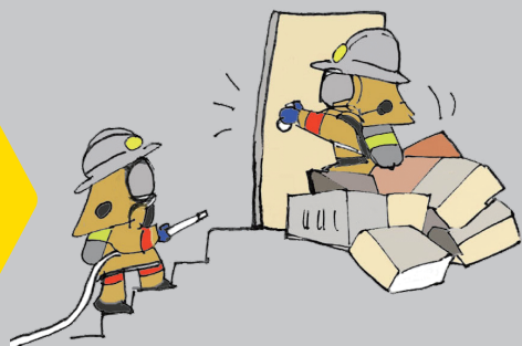
消火活動の支障に