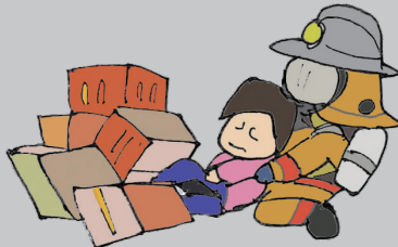
救助活動の支障に