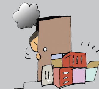
避難障害や防火戸の 開閉障害に